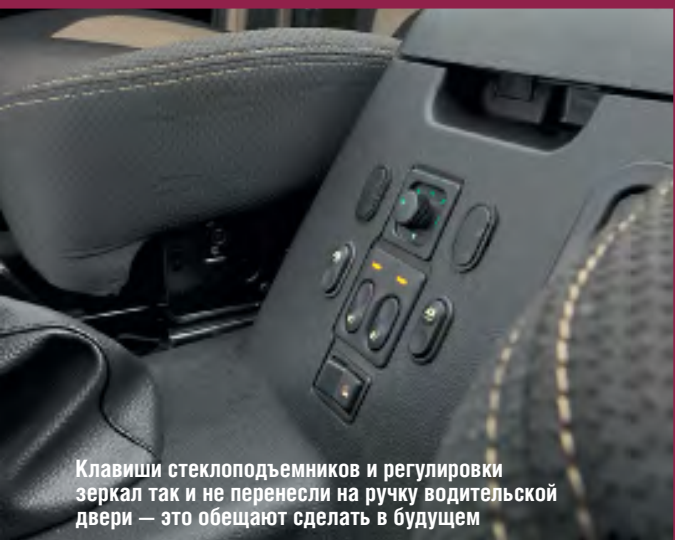
Клавиши стеклоподъемников и регулировки зеркал так и не перенесли на ручку водительской двери — это обещают сделать в будущем