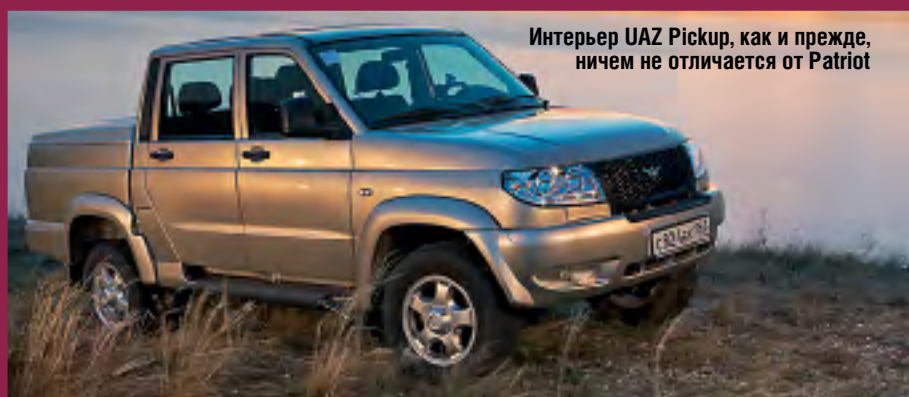
Интерьер UAZ Pickup, как и прежде, ничем не отличается от Patriot

Наконец, в штатное оснащение всех машин вошла двухдиновая аудиосистема. Вид у нее, прямо скажем, затрапезный, но свою работу новая «музыка» выполняет исправно: проигрывает MP3-файлы, в том числе с внешних носителей. Нам, к примеру, без труда удалось соединить ее с телефоном через Bluetooth.