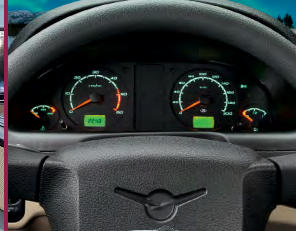
▲ Компоновка приборного щитка осталась прежней. Изменили шкалы приборов и подсветку — она стала светодиодной