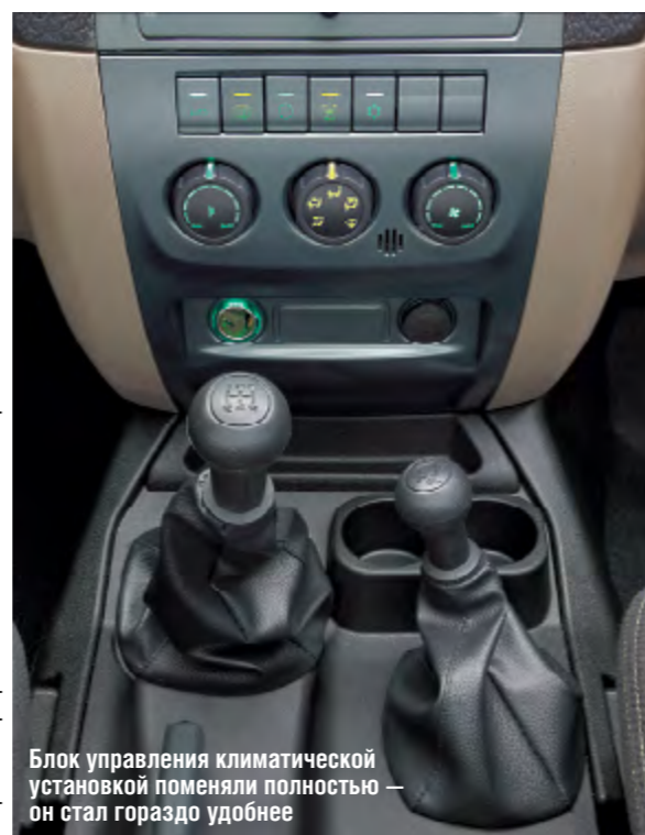
Блок управления климатической установкой поменяли полностью — он стал гораздо удобнее

В системе отопления и кондиционирования наконец-то появились новые воздуховоды: салон стал прогреваться и проветриваться быстрее. Блок управления «климатом» обзавелся удобными «маховичками», которые используются большинством автопроизводителей.