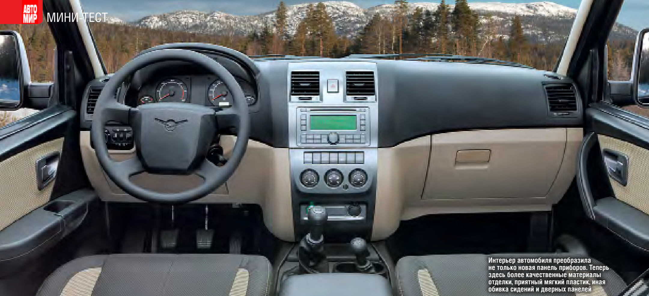
Интерьер автомобиля преобразила не только новая панель приборов. Теперь здесь более качественные материалы отделки, приятный мягкий пластик, иная обивка сидений и дверных панелей